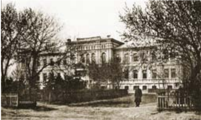
Здание окружного суда. 1896 г.