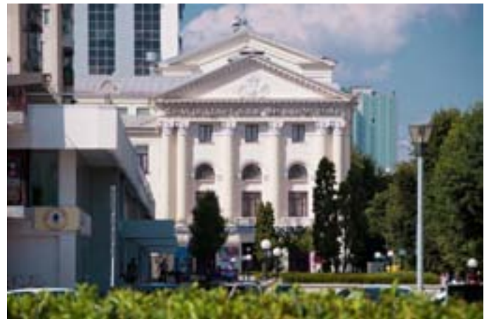
Краснодарская филармония им. Григория Пономаренко (до 1973 г. - театр драмы им. М. Горького)

архитектора Ф. Шехтеля. Позднее, после установления советской власти здание стало домом для труппы театра драмы им. М. Горького. В 1943 году здание серьезно пострадало, были уничтожены несущие конструкции и принимается решение о реконструкции. В начале 50-х годов восстановление было завершено, но фасад предстал перед горожанами в сильно измененном виде. Отныне мы видим здание оформленное в классическом стиле, что напомним, очень характерно для сталинского времени.