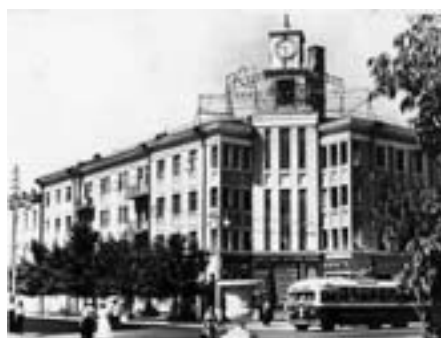
Жилой дом. Реконструкция 1950-х г.г.