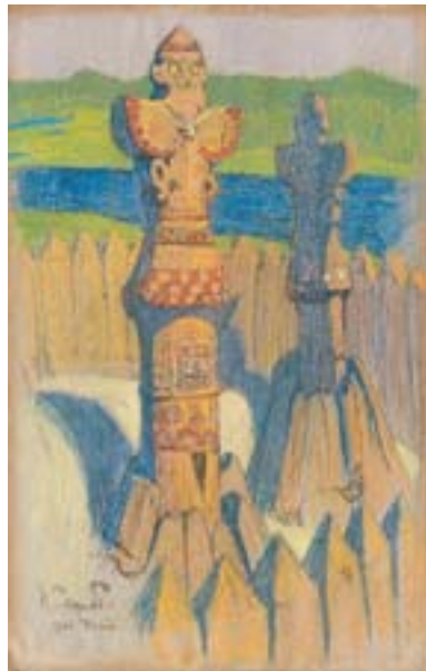
Рерих Н.К. Идолы. 1901