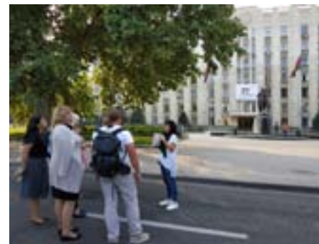
Пешеходные экскурсии «Советский Краснодар»