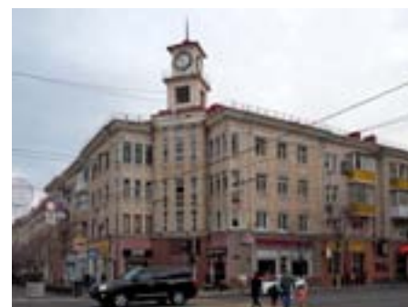
Жилой дом сегодня. Фото 2020 г.

В 1902 году на плановом месте купленном у потомков атамана Рашпиля было заложено и за год возведено здание конторы госбанка. Проект простого и лаконичного здания в стиле неоклассицизм принадлежал авторству екатериновдарского зодчего Ивана Климентьевича Мальгерба. Симметрия, простые формы, классический декор – во всем простая и сдержанная классика. О начале XX века напоминают лишь два «креативных» момента, это смещение входа от центра в правый объем и отступ от красной линии, что делает и здание и пространство перед ним более просторным и легким. А если взглянуть на здание с юго-востока то можно заметить как игриво и в такт вторят друг другу сандрик над входом и фронтоном южного фасада.