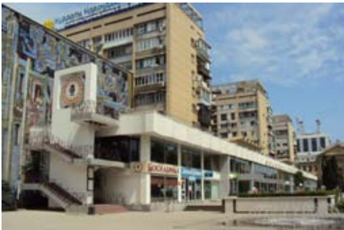
Краснодарский Дом книги, 1977 г., архитектор А.Г. Якименко