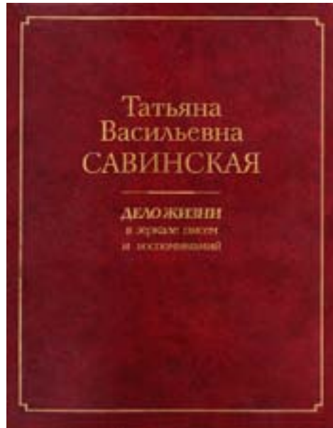
Т. В. Савинская. ДЕЛО ЖИЗНИ. Составитель И. В. Балакова