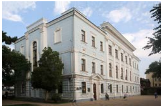
Выставочные залы Краснодарского краевого художественного музея им. Ф. А. Коваленко (здание Екатериновдарской конторы Госбанка, реконструкция 1954 г., архитектор Е.В. Краснова)