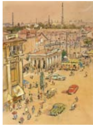
СЫСОЕВ А. С. Улица Гоголя. Краснодар