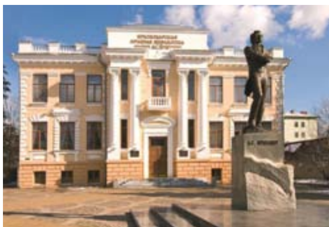
Площадь искусств. Памятник А. С. Пушкину у здания библиотеки его имени