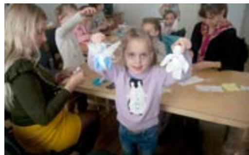
Мастер-класс для детей и родителей по изготовлению кукол