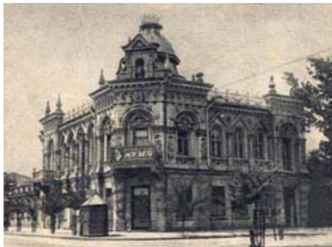
Краснодар. Кубанский художественный музей им. А.В. Луначарского. Фото 1930-х гг.