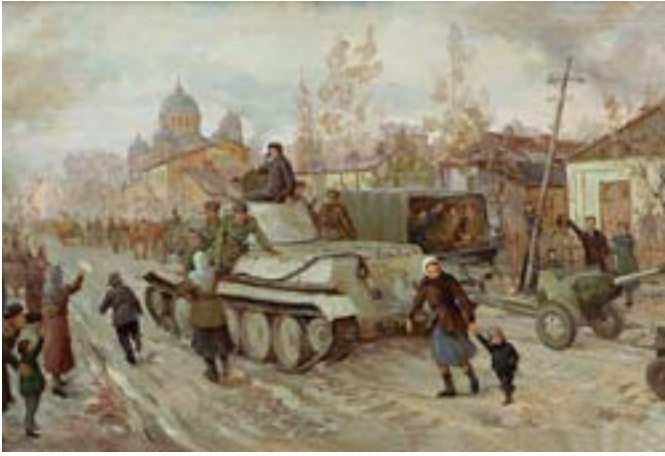
РУЖЕЙНИКОВ П. Н. Вступление Красной армии в Краснодар 12 февраля 1943 года