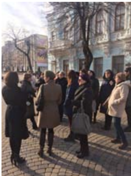
Начало «Исторических прогулок» у здания музея