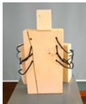
ТАТЬЯНА КОЗОРЕЗ Из серии: «Люди и крылья». 2019.