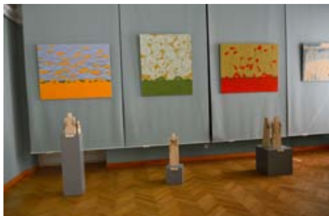
Фрагмент экспозиции проект «Башни 100-летию».

И, что наиболее важно для России, что 100-летие Башни III Интернационала Владимира Татлина, признана всемирной организацией ЮНЕСКО главным архитектурным объектом XX века, в котором были сфокусированы все открытия и достижения грядущего столетия. Являясь визитной карточкой Русского конструктивизма, она знаменует финальный крупный юбилей, связанный со 100-летием Русского Авангарда (1919-2019 гг.).