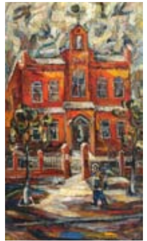
АСЛАНЯН М. Е. Центральная часть из триптиха «Пасха»

в Краснодаре. Участники экскурсии смогут прочувствовать романтику старого Екатеринодара.