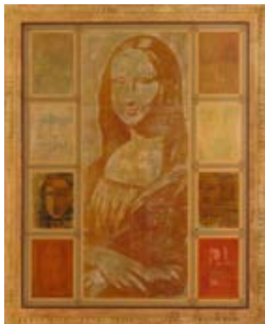
ИГОРЬ МИХАЙЛЕНКО «9 фрагментов». 2005