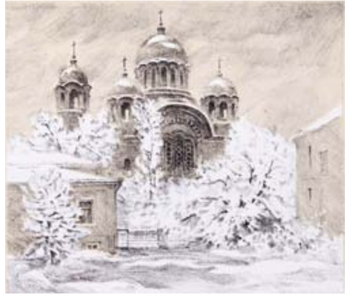
ЗАБЕЛИНА Г. К. Красный (Екатерининский) собор