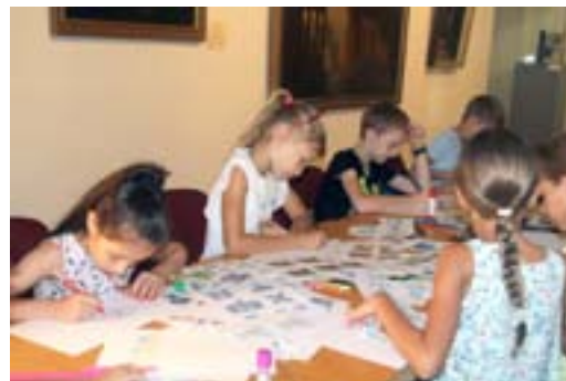
Тематическое занятие с учениками начальной школы