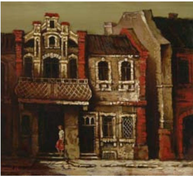
ВОРЖЕВ С. Д. Вечерний Краснодар