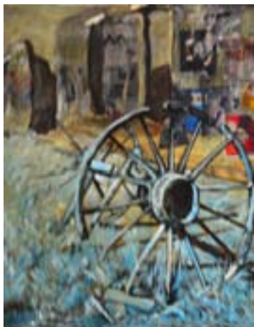
ГАЛИНА ХАЙЛУ «Колесо». 2006