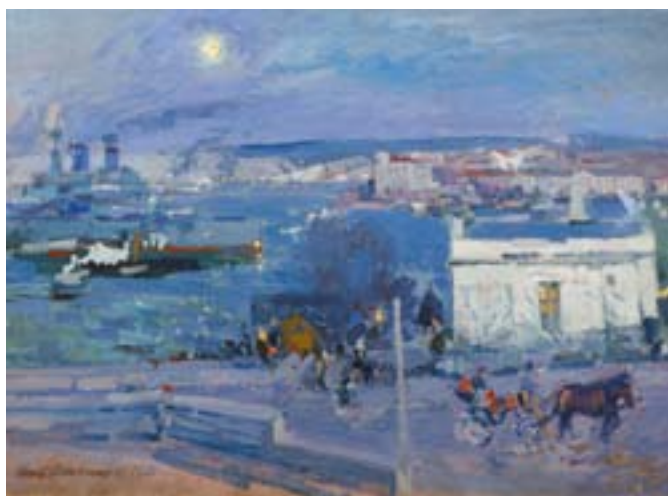
КОРОВИН К. А. Гавань в Севастополе. 1916.