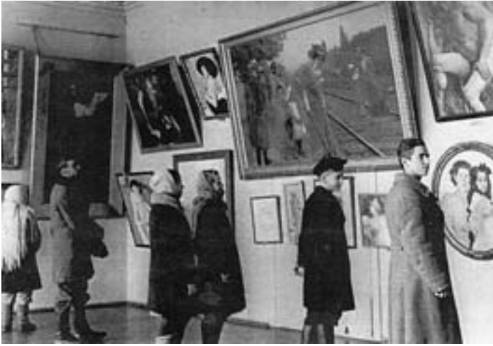
Первая послевоенная выставка, открытая в Краснодаре после возвращения коллекции из Соликамска