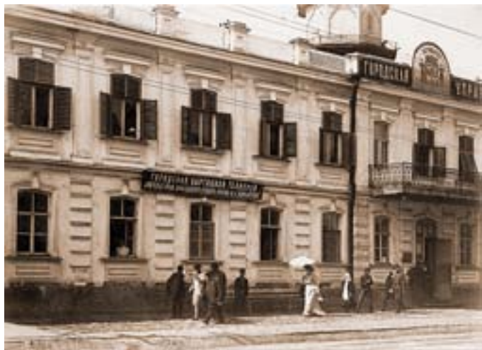
Екатеринодар. Здание Городской думы, в котором была открыта Картинная галерея. Фото 1910-х гг.