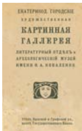
Рекламный проспект Екатеринодарской картинной галереи им. Ф. А. Коваленко. 1910-е гг.