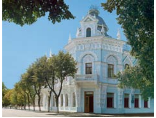
Краснодарский краевой художественный музей имени Ф. А. Коваленко. Фото 2000 г.