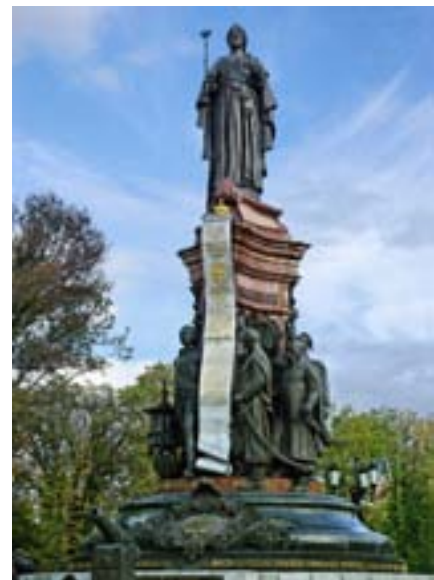
Памятник Екатерине Великой в Екатерининском сквере