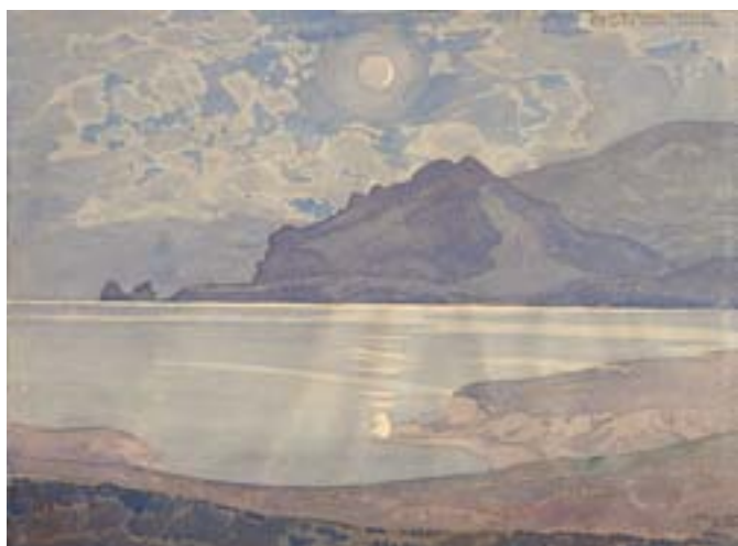
ВОЛОШИН М. А. Крымский этюд. 1924