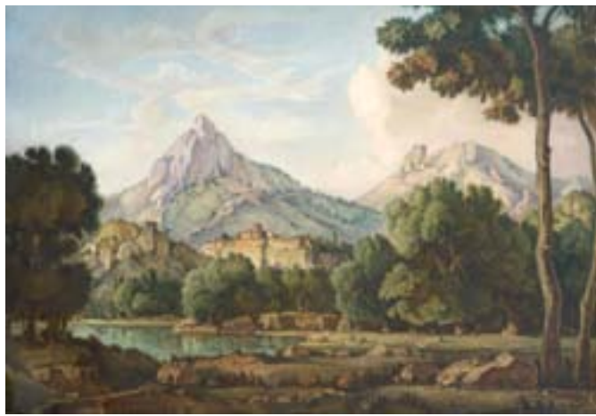
БОГАЕВСКИЙ К.Ф. Древний город