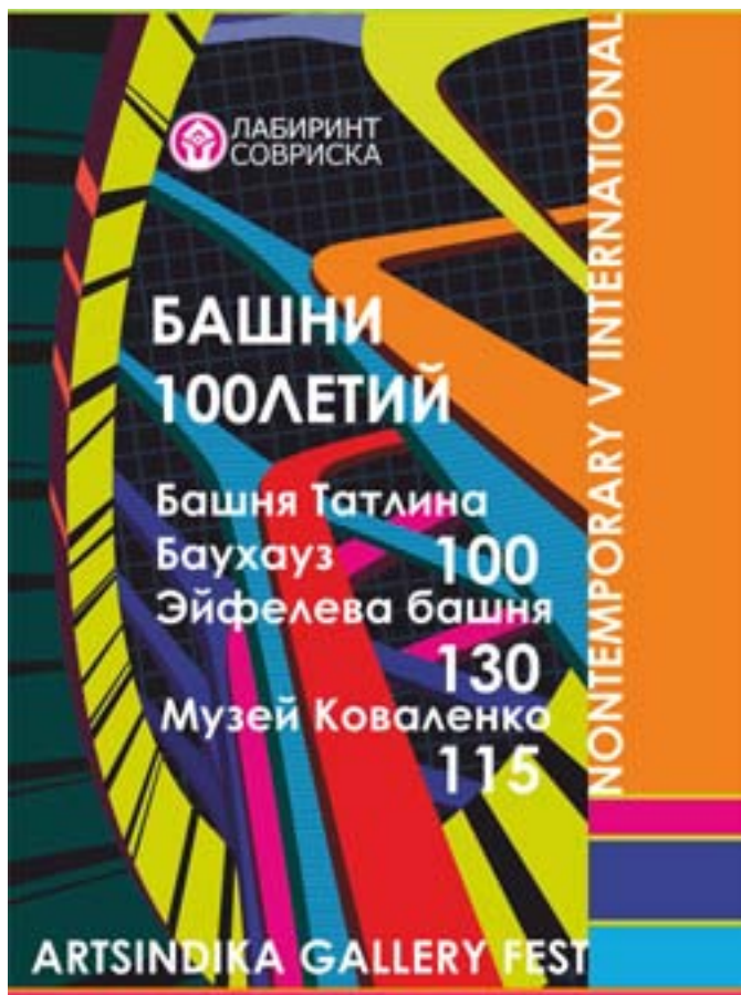
Электронная афиша проекта