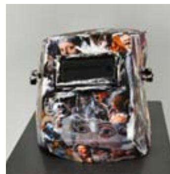
ЯНА АЛАЛЫКИНА Из серии: «Инструменты для искусствоведа». 2018.